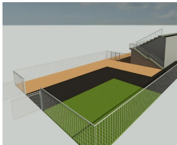
Spazio a fianco della tribuna da dedicare alla Club House. Vista dal retro tribuna e dal lato piscina

Analizzando le soluzioni adottate da altre realtà abbiamo notato che la maggior parte di esse (soprattutto quelle con un numero di tesserati simile al nostro) ha costruito gli spazi Club House in questo modo: